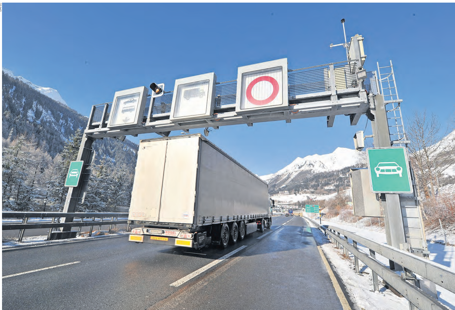
Der alpenquerende Güterverkehr muss reglementiert und vermindert, aber auch kontrolliert werden (im Bild ein Lastwagen bei der termischen Kontrolle in Airolo).

tunneln in Italien und Frankreich. Bis heute hat der Druck der Initiative aber nicht ausgereicht, um die Alpentransitbörse zu realisieren. Als grösstes Hindernis erweist sich einmal mehr die Vereinbarkeit mit dem europäischen Recht, obwohl mehrere Studien diese bestätigen. Eine Studie des Bundesamts für Raumplanung kam 2007 zum Schluss: «Die Alpentransitbörse ist ein geeignetes Instrument zur Verla-