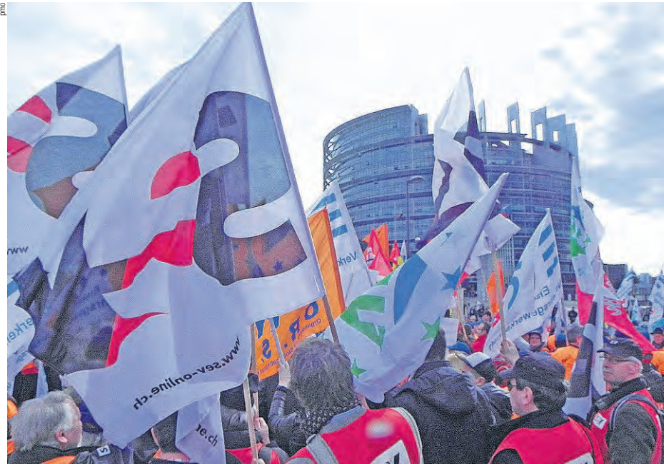
Die SEV-Fahne inmitten der bunten Kundgebung vor dem Europäischen Parlament in Strassburg.

Auf Transparenten und Flugblättern wird vor den Folgen gewarnt, die eine weitere Liberalisierung des Schienenver-