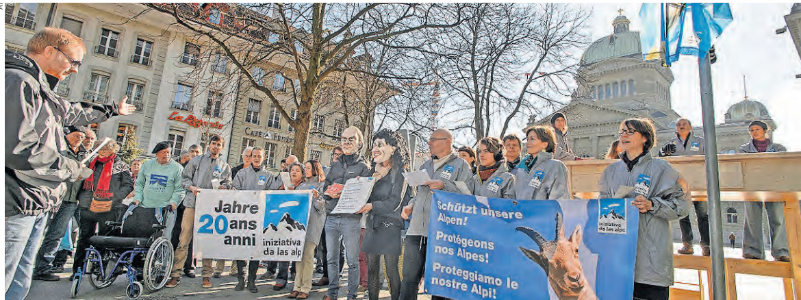
Die Aktivistinnen und Aktivisten der Alpen-Initiative haben auf dem Bundesplatz auf den Tisch gehauen.