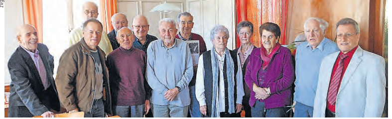
Von 25 Jubilar/innen folgten 13 der Einladung zum Apéro.