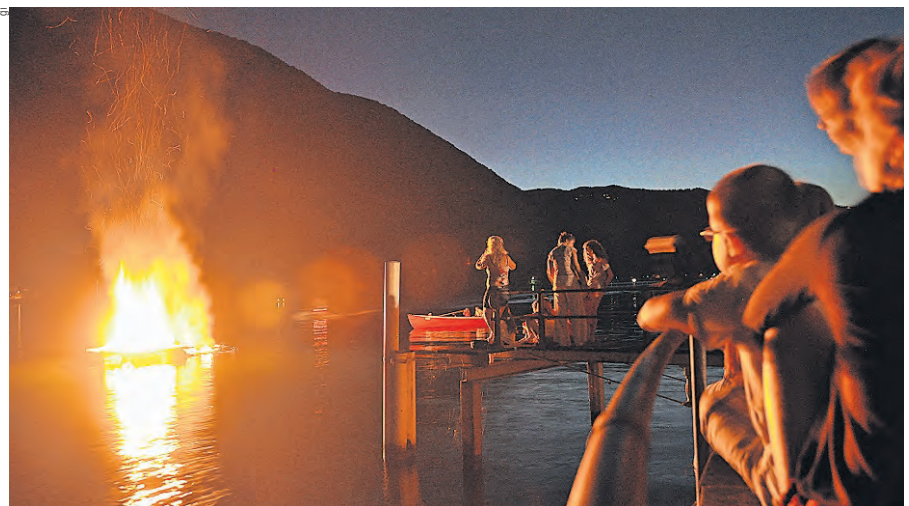
Die Alpen-Initiative ist bekannt für auffällige und spektakuläre Aktionen. So entzündet sie seit Jahren regelmässig «Höhenfeuer», um an den Alpenschutz zu erinnern.