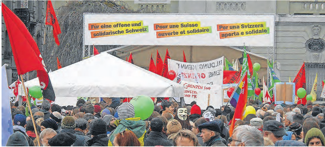
Der ganze Bundesplatz voll mit bunten Menschen, Ballons und Fahnen: Die Demo wurde zum Grossaufmarsch.

Erwartet wurden 5000 Personen, gekommen sind 12 000: Die Kundgebung für eine offene und solidarische Schweiz war ein deutliches Zeichen.