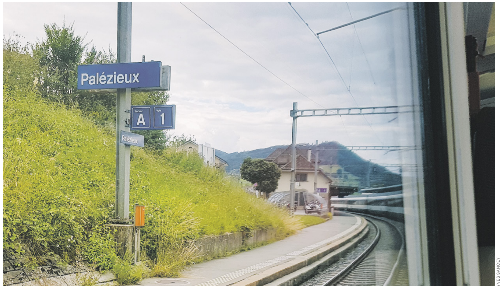
Der Bahnhof Palézieux und seine Kurve. Keine Toilette und kein Pausenlokal für Fahrpersonal, dem dort eine Arbeitsunterbrechung aufgezwungen wird.

Die nächste SEV-Zeitung Nr. 10 erscheint am 3. September, mit Redaktionsschluss für den Sektionsteil am 24. August, 12 Uhr. Alle wichtigen Informationen findet ihr in der Zwischenzeit auf unserer Webseite sev-online.ch . Wir wünschen euch eine erholsame und warme Sommerzeit.