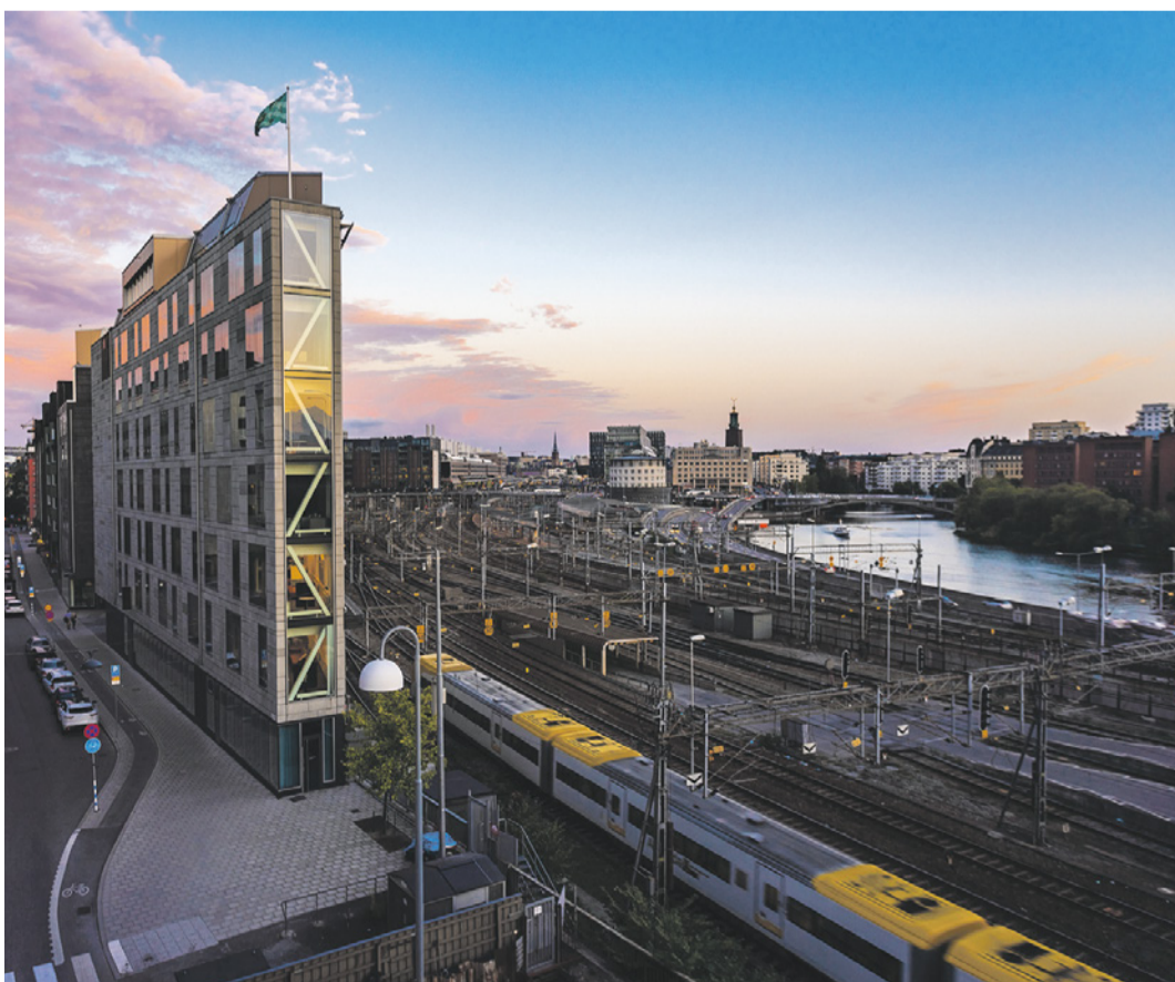
Wichtiger Erfolgsfaktor des Schweizer öV-Systems: miteinander statt gegeneinander.

Zuerst einmal hoffe ich, dass sich der Bundesrat die Erkenntnisse für den öffentlichen Verkehr auch bei den anstehenden Diskussionen zu den finanziellen Auswirkungen der Pandemie vor Augen halten wird. Verbesserungen braucht es sicherlich im Busbereich, wo leider Ausschreibungen unter bestimmten Voraussetzungen vorgegeben oder möglich sind. Hier stehen die GAV-Pflicht für die Unternehmen und ein Verbot von Subunternehmen im Fokus. Und im Güterverkehr müssen sich endlich alle Beteiligten von der Idee verabschieden, dass Güterverkehr eigenwirtschaftlich betrieben werden kann.