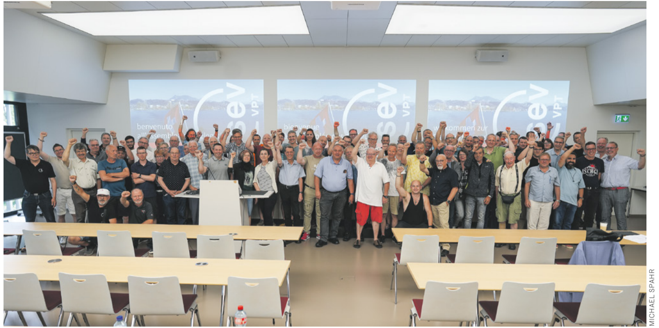
Environ 90 membres et invités de la VPT étaient réunis et se sont montrés combatifs pour un avenir prometteur.

Michael Spahr/Ueli Müller michael.spahr@sev-online.ch