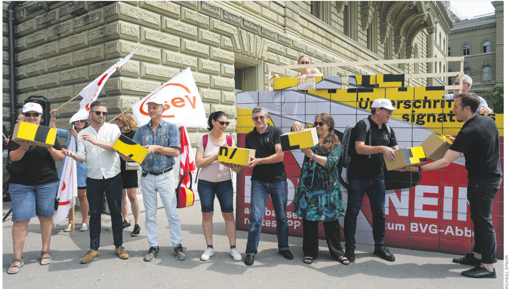
Le 27 juin, les syndicats et les partis de gauche ont remis les 141726 signatures (presque trois fois plus que nécessaire) contre la réforme LPP.

Les recommandations du SECO : les employeurs doivent mettre à disposition de la protection solaire et de l'eau, adapter les horaires de travail, prévoir plus de pauses ou réduire le rythme de travail (si nécessaire, les exiger !). En cas de faiblesse, problèmes circulatoires, crampes, se rendre immédiatement dans un endroit frais et informer ses supérieurs.