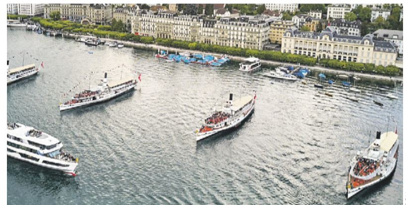
La flotte des bateaux de la SGV, but de la sortie du 24 août.

Nous remercions encore une fois la présence des membres d'honneurs et invités, ce fut une journée joyeuse et chaleureuse, rendez-vous le 24 août pour notre sortie.