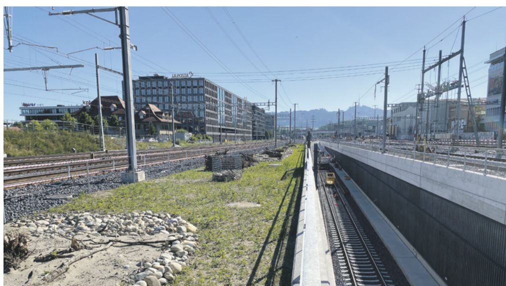
Infrastructure ferroviaire: l'augmentation du trafic rend nécessaire le désenchevêtrement dans les nœuds ferroviaires comme celui de Wylerfeld (BE). Ailleurs, il faudra parfois attendre.

Le Conseil fédéral propose d'allouer 15,1 milliards de francs à l'exploitation, à l'entretien et à la modernisation de l'infrastructure ferroviaire pour les années 2025 à 2028. Cela représente certes 0,7 milliard de plus qu'en 2021-2024, mais en raison du renchérissement, de la hausse des prix de l'électricité et de la baisse des recettes liées au prix des sillons, les fonds disponibles seront vraisemblablement moins importants en termes réels qu'en 2021-2024. Ce qui n'est pas urgent doit donc être reporté.