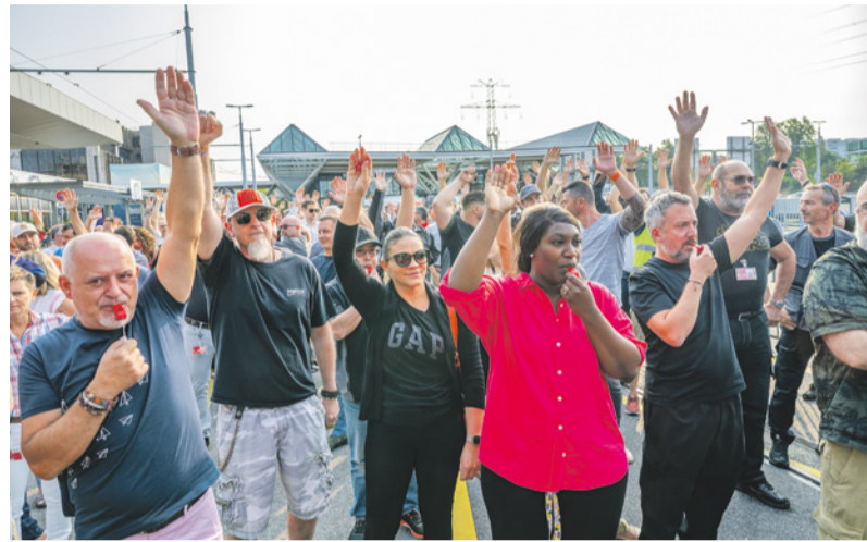
Grève historique à l'aéroport. Annuités et primes aléatoires repoussées.

Yves Sancey Après avoir bloqué tous les vols le 30 juin de 6 à 10 h le matin, le personnel engagé directement par Genève Aéroport – 960 salariés – a obtenu un accord inespéré. Le SEV, a soutenu les grévistes. Le syndicat ssp et la direction de l'Aéroport se sont entendus sur un nouveau cadre de discussion. Cela repousse l'entrée en vigueur de la réforme salariale prévue au 1 er septembre 2025 au lieu du 1 er janvier 2024 et, d'ici là, ils doivent s'entendre sur les paramètres et les modalités de mise en œuvre. Le projet de réforme n'est pas enterré, certes, mais le rapport de force est maintenant clairement en faveur des employés. Pour le ssp, satisfait de l'accord, cette étape marque l'ouverture d'une nouvelle « page blanche ». Le partenariat est remis au centre.