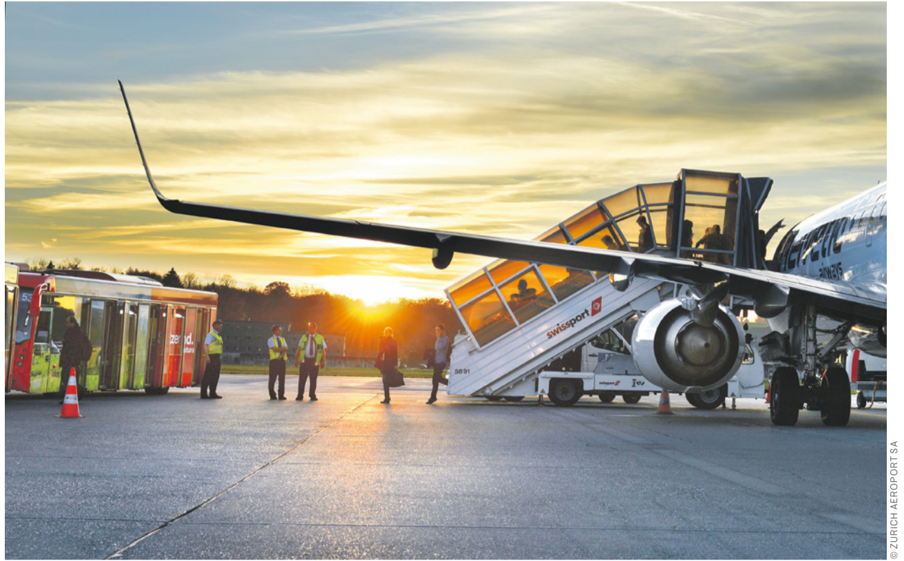
Parmi les entreprises de services des aéroports de Zurich et de Genève qui ont déjà conclu des CCT, on trouve les antennes locales de Swissport, la plus grande société de services d'assistance en escale du monde.