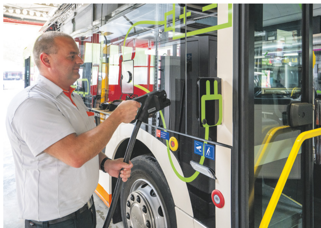
À Soleure, BSU veut des bus 100% électriques d'ici 2035. Un défi pour nos collègues des ateliers.