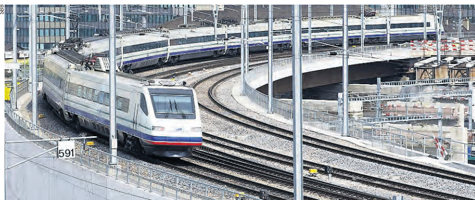
Bald ist der Neigezug nach Italien wieder im SBB-Kleid unterwegs – ab Fahrplanwechsel nur noch am Gotthard.

Positiv wertet der SEV auch den Schritt zum traditionellen Kooperationsmodell, das er als richtig für die Zusammenarbeit zwischen den Staatsbahnen erachtet. «Offensichtlich wächst unter den Staatsbahnen die Erkenntnis, dass Zusammenarbeit weit eher zum Erfolg führt als der ruinöse Konkurrenzkampf», meinte SEV-Vizepräsident Manuel Avalone. Peter Moor