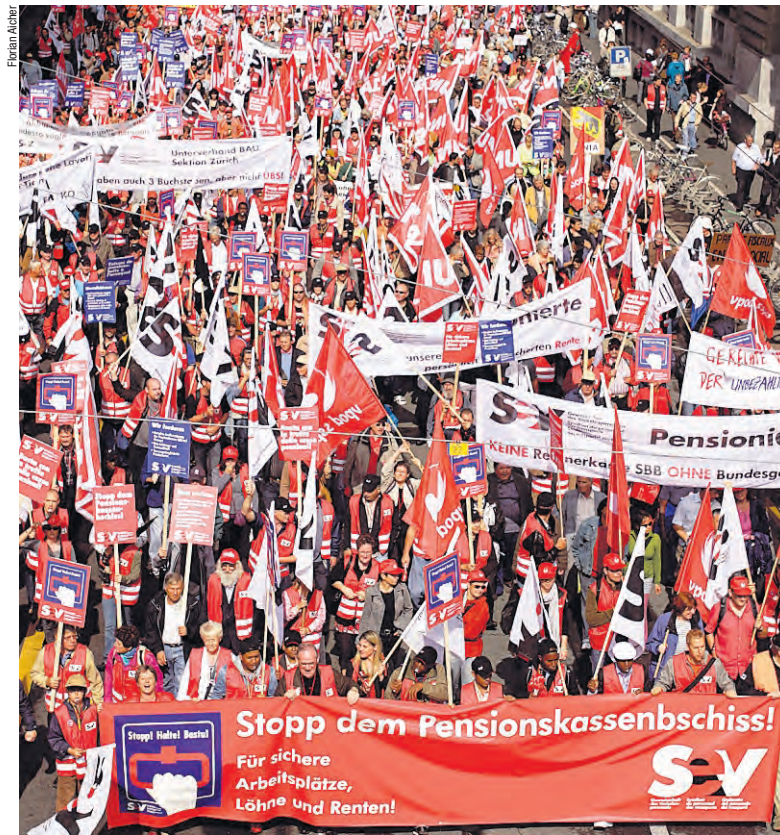
So bunt wie noch nie: Der SEV unterwegs von der Schützenmatte zum Bundesplatz.

SBB baut in den Rangierbahnhöfen über 50 weitere Stellen ab