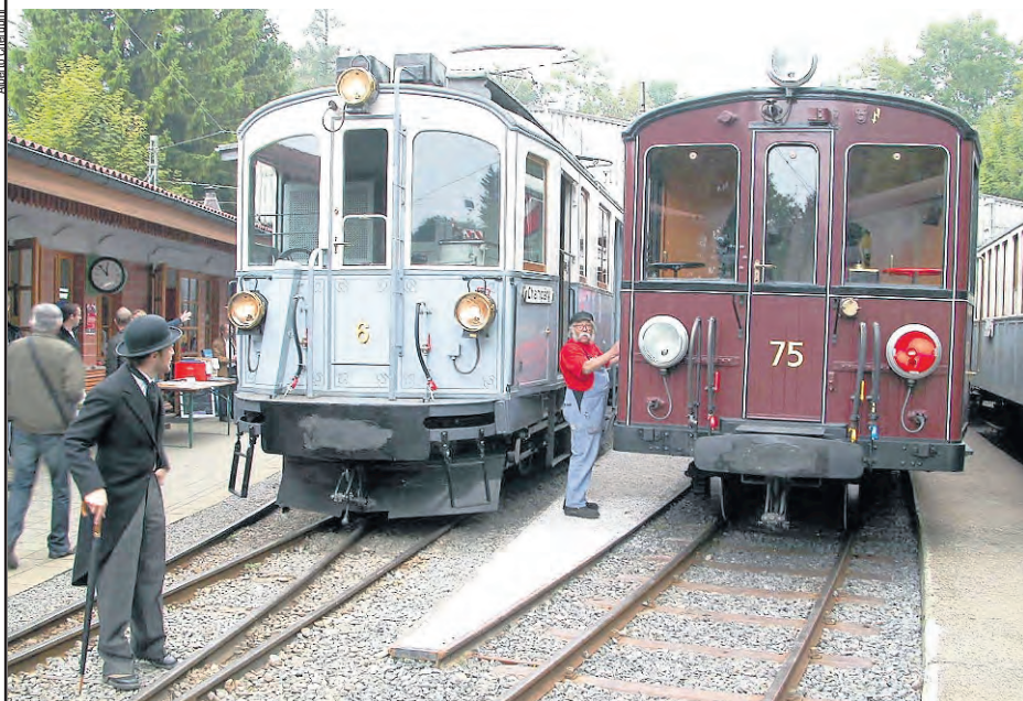
An den letzten drei Wochenenden empfing die Museumsbahn Blonay-Chamby allerlei historische Fahrzeuge von Walliser Bahnen. Links ein Triebwagen der Bahn Monthey-Champéry (Morgins), rechts ein Fahrzeug der Linie Martigny-Châtelard des Vereins Train Nostalgique du Trient.