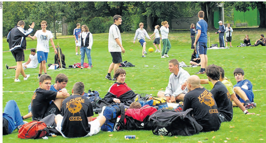
Jährlich stellt die SBB rund 250 Lehrabgänger/innen von Login, dem Ausbildungsverbund der öffentlichen Verkehrsunternehmen, ein. Bei den Lernenden sehr beliebt ist der Login-Sporttag – siehe Bericht der SEV-Jugend auf Seite 15.